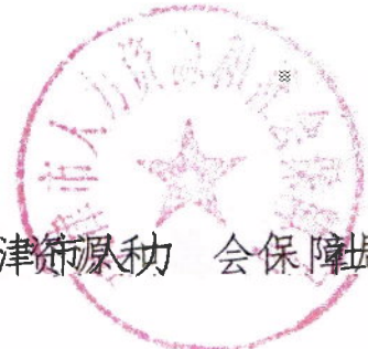
天津市人力资源和社会保障局