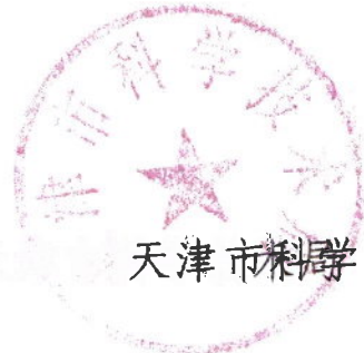
天津市科学技术局