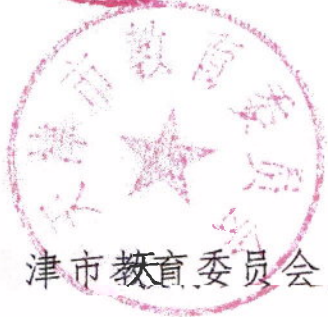
天津市教育委员会